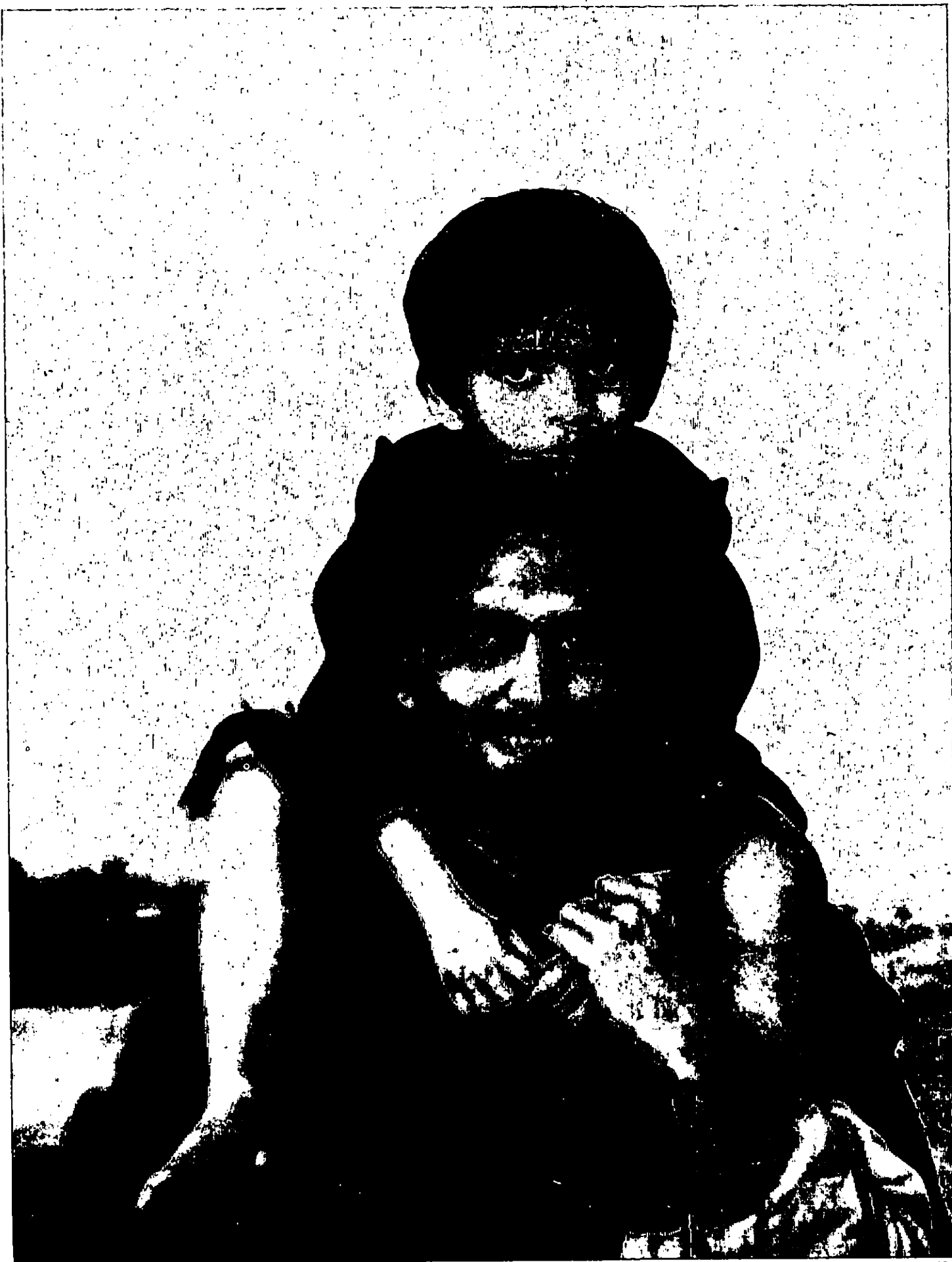
• APUR SANSAR • (LE MONDE D'APU), DE SATYAJIT RAY (SOMITRA CHATTERJEE).